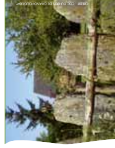
Halte de palis à Ste-Anne-sur-Vilaine