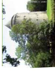
Tour Duguesclin à Grand-Fougeray