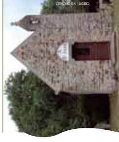
Chapelle Ste Anne à Ste-Anne-sur-Vilaine